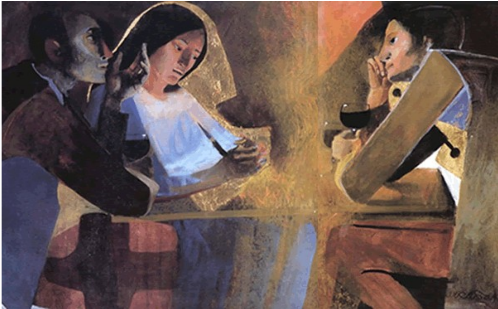
Les disciples d'Emmaüs - tableau d'Arcabas

Méditation d'après Notre-Dame du Web : https://www.ndweb.org/art/emmaus/